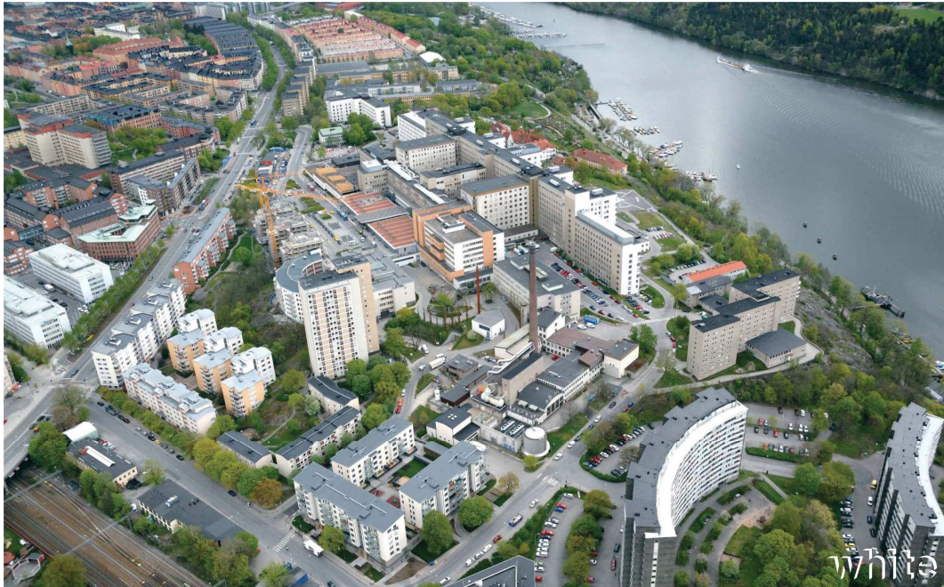
Flygfoto. Befintliga förhållanden på Södersjukhuset.

Varutransporter sker liksom idag via Tantogatan till Jägargatan eller Marmorsgatan. Tantogatan/Jägargatan är även en möjlig ambulansväg för att nå det nya ambulansintaget. Alternativa ambulansvägar ska studeras inom planarbetet.