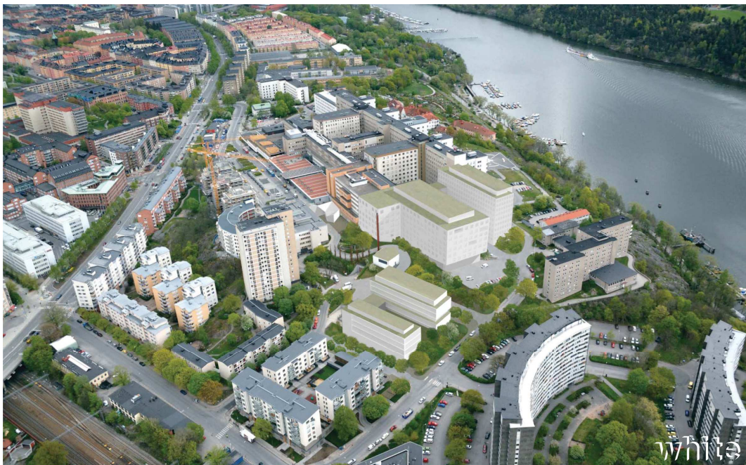
Fotomontage. Tidig volymstudie av förslaget. Gestaltningen kommer att studeras vidare under processen. Illustration: White arkitekter.